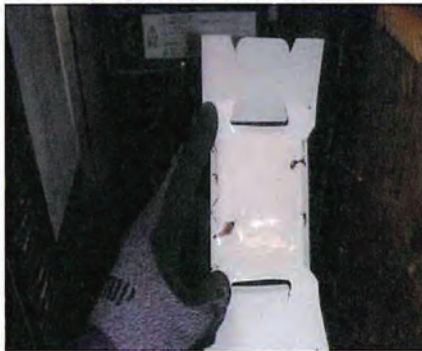
調査トラップ捕獲あり