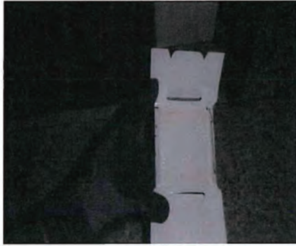
調査トラップ捕獲なし