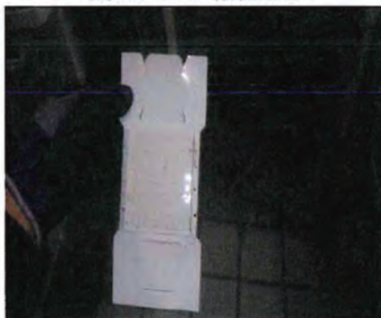
調査トラップ捕獲なし